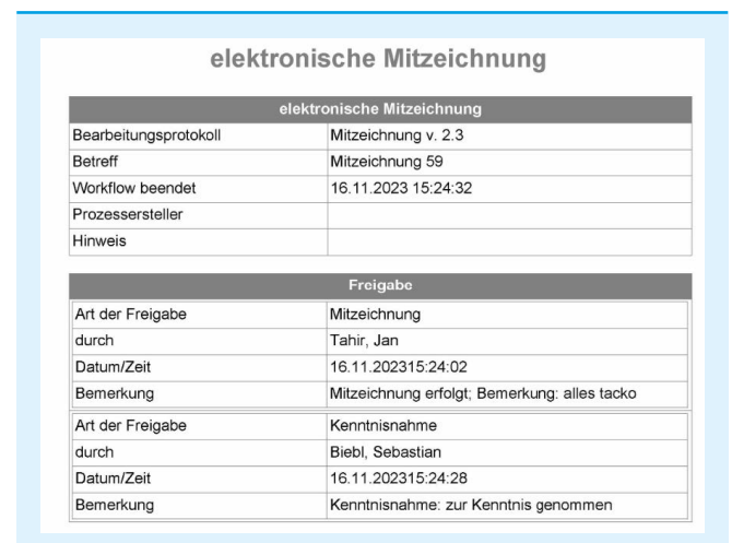
Beispiel Bearbeitungsprotokoll (Ausschnitt)

Dieses Protokoll enthält alle Arten der Freigabe, die Beteiligten, Datum und Uhrzeit sowie eine Bemerkung zum Zeichnungsprozess.